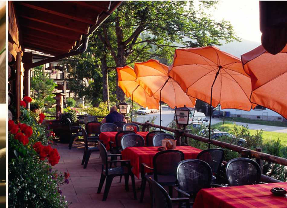
Jetzt im „Holzkäfer“ bayerische Gastfreundschaft genießen